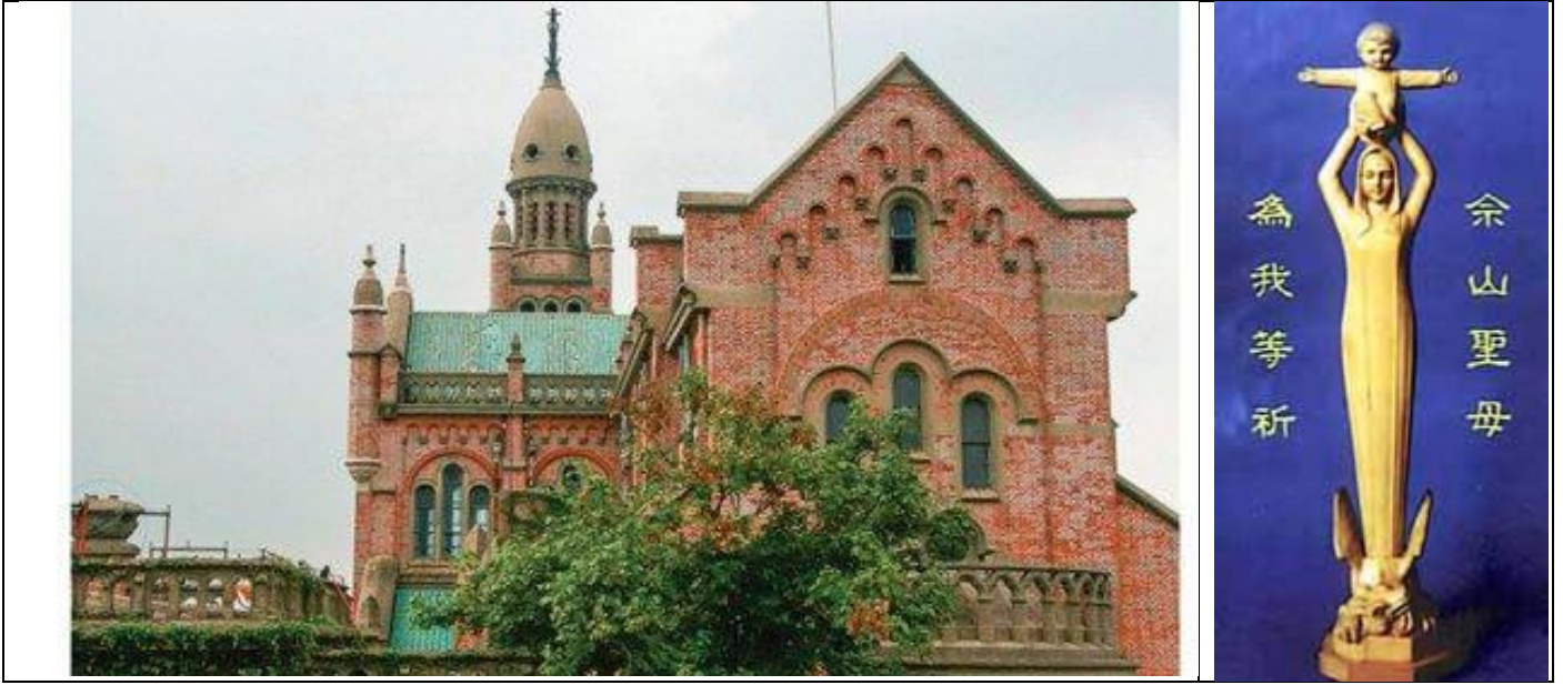
Đền thờ Đức Mẹ Sầm Sơn

Để kết luận, Đức Thánh Cha ca ngợi lòng sùng kính của người Công giáo Trung Quốc đối với Đức Mẹ Sầm Sơn (Sheshan), tại Đền thánh nằm gần Thượng Hải và có ngày lễ kính được cử hành vào ngày 24 tháng 5.